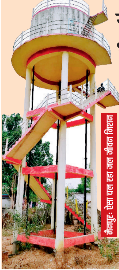
नैनपुर: ऐसा चल रहा जल जीवन मिशन