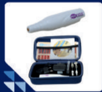
इलेक्ट्रिक पेडिक्योर किट