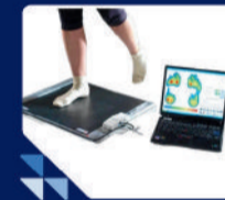
ऑटोमेटिक फुट स्केनर (पेशाव मैपिंग)