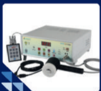
HCPS मिस्टम (एडवांस फुट केयर सेटअप)