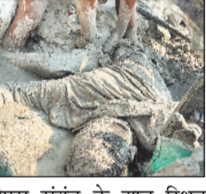
एचटीपीएस संयंत्र के झाबू स्थित राखड़ बांध का तटबंध कुछ दिनों पूर्व क्षतिग्रस्त हो गया था।

हसदेव ताप विद्युत संयंत्र के झाबू स्थित राखड़ बांध के क्षतिग्रस्त तटबंध के मरम्मत कार्य के दौरान एक बार फिर राखड़ बांध का तटबंध टूट गया और भारी मात्रा में बांध में संग्रहित राखड़युक्त मलबा बहने लगा। इस दौरान मरम्मत कार्य में लगा जेसीबी मशीन का ऑपरेटर राखड़युक्त पानी के सैलाब में बहकर दब गया। जिससे उसकी मौके पर ही मौत हो गई। वहीं दो मजदूरों ने किसी तरह भाग कर अपनी जान बचाई। आखिरकार घंटों की मशकत के बाद रेस्क्यू कर जेसीबी ऑपरेटर के शव को मलबे से बाहर निकल गया। घटना के बाद मौके पर मौजूद मजदूरों और कर्मचारियों में अफरा-तफरी की स्थिति निर्मित हो गई वहीं प्रबंधन के हाथ पांव फूल गए। छत्तीसगढ़ राज्य विद्युत उत्पादन कंपनी के 1340 मेगावाट क्षमता वाले