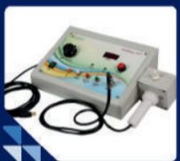
बायोथेजी VPT (न्यूट्रोपैथी जांच)