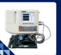
ऑटोमेटिक ABI डॉप्लर